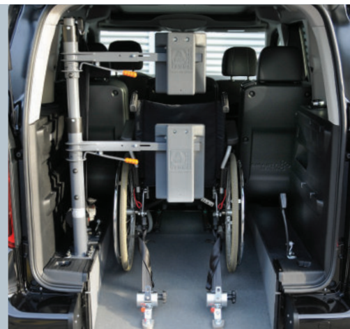
Das Fahrzeug kann mit der Kopf- und Rückenstütze FUTURESAFE ausgestattet werden.