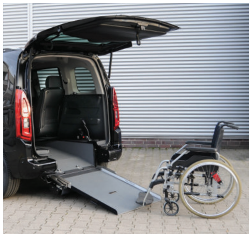
Bei ausgeklappter Rampe lässt sich das Fahrzeug bequem mit dem Rollstuhl befahren.