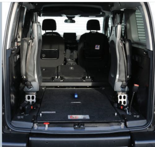
Die eingeklappte EASYFLEX Rampe ermöglicht die volle Nutzung des Kofferraums.