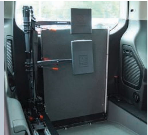
Das Fahrzeug kann optional mit der Kopf- & Rückenstütze FUTURESAFE ausgestattet werden.