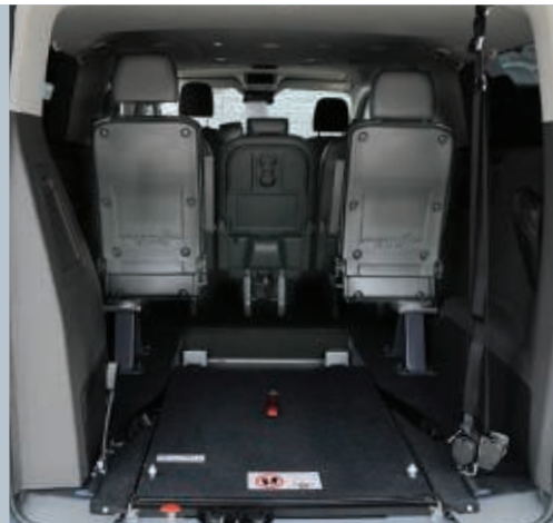
Dreh-Klappsitze in 3. Reihe und die EASYFLEX Rampe ermöglichen eine flexible Nutzung.