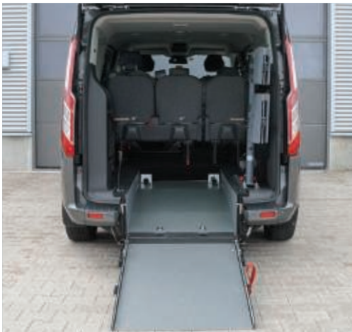
Bei ausgeklappter Rampe lässt sich das Fahrzeug bequem mit dem Rollstuhl befahren.